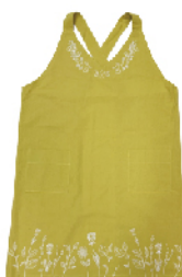
イエローオリーブ