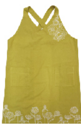
イエローオリーブ